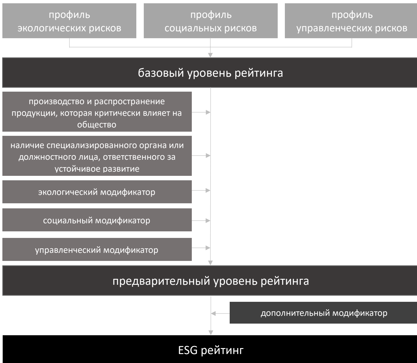
Рисунок 2.1. Схема определения уровня ESG рейтинга

Логика, используемая BIK Ratings при определении ESG рейтинга организаций, представлена на рисунке 2.1 .